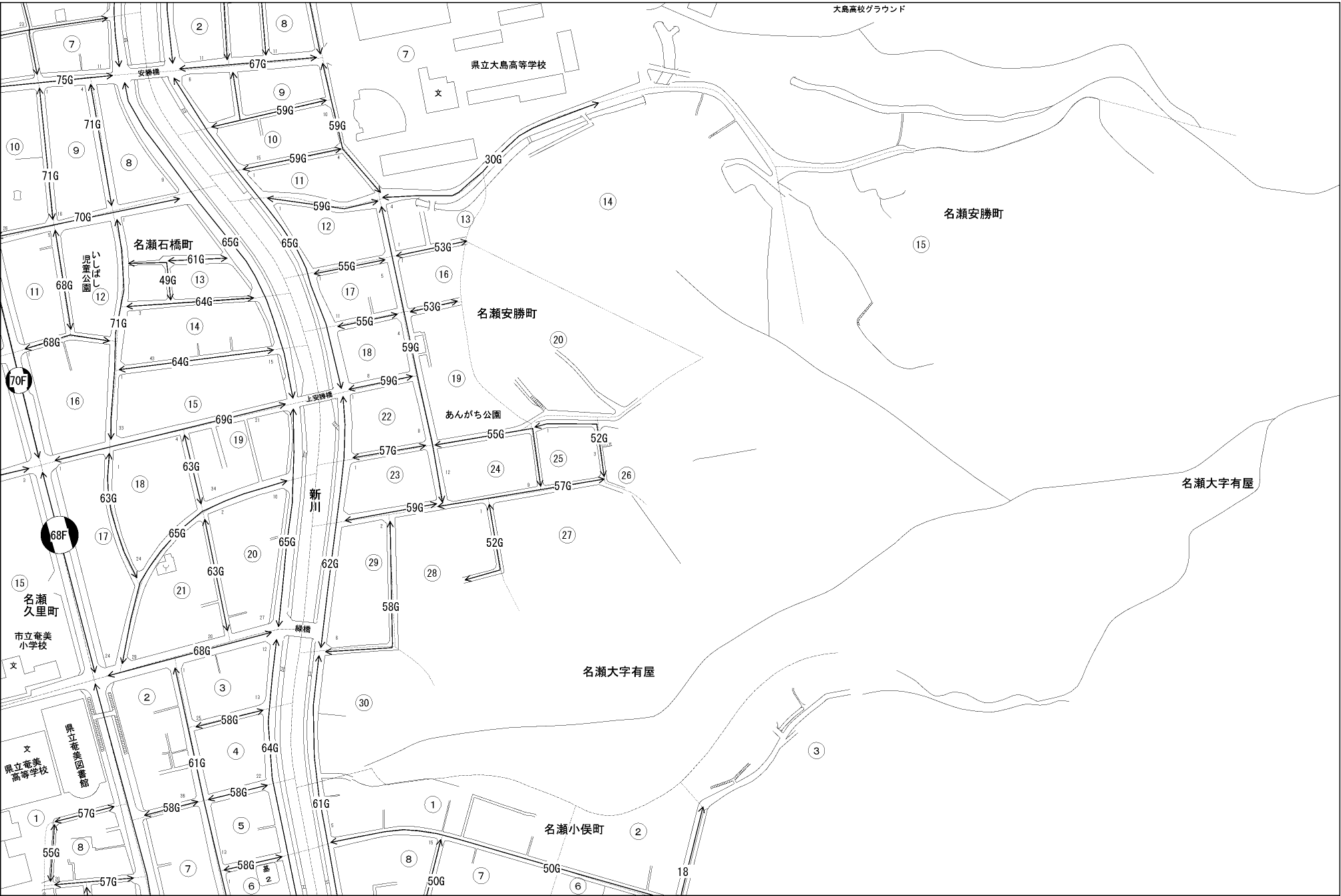
大島高校グラウンド