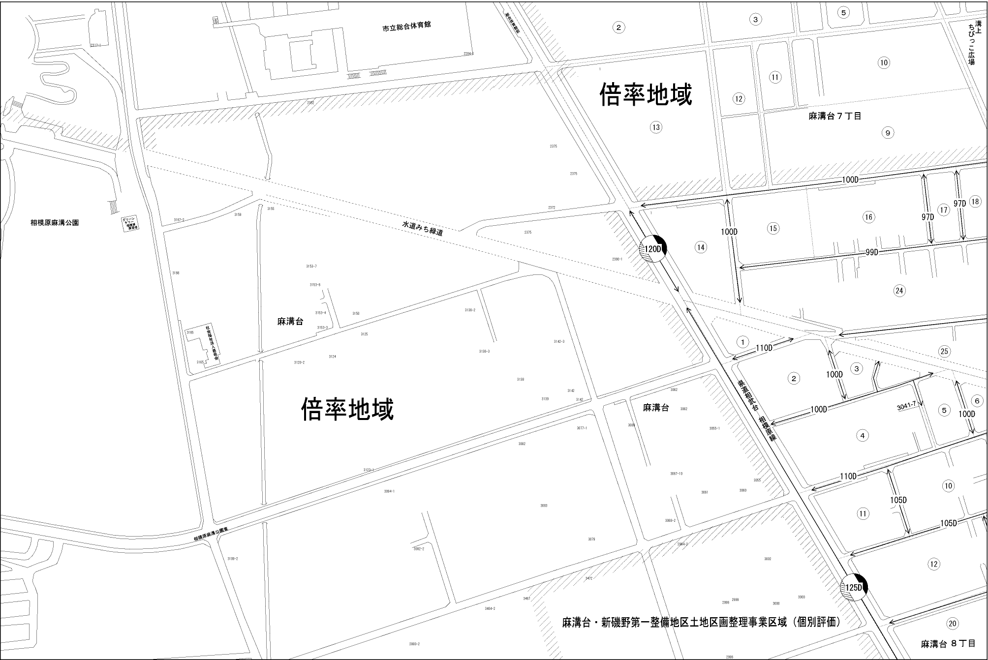
麻溝台・新磯野第一整備地区土地区画整理事業区域 (個別評価)